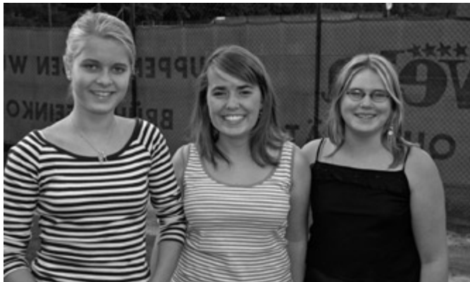
Diese drei jungen Damen repräsentieren unseren weiblichen Nachwuchs und berechtigen zu den schönsten Hoffnungen.